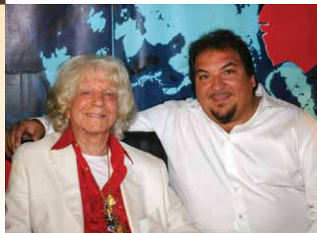
Avec Manitas de Plata