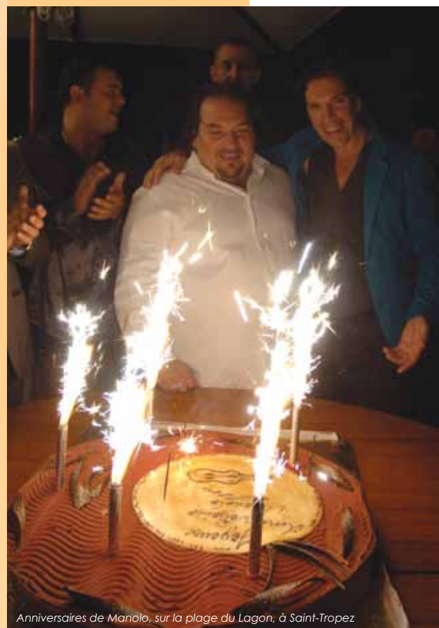
Anniversaires de Manolo, sur la plage du Lagon, à Saint-Tropez

Texte Danielle Roche